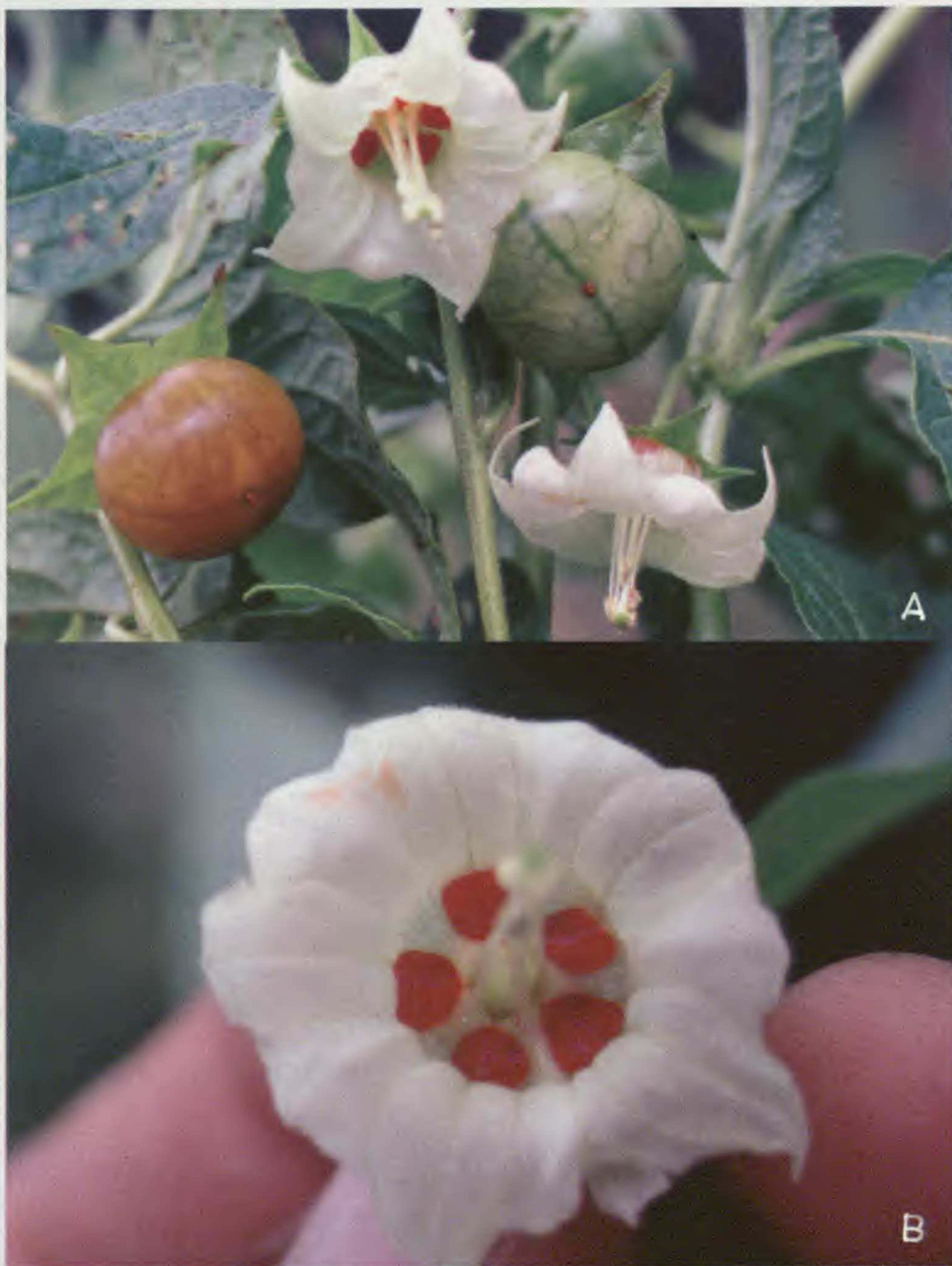
Fig. 3. Jaltomata dilloniana S. Leiva. A. Rama florífera; B. Flor en antésis mostrando las 5 cavidades con néctar rojo. (S. Leiva 2687, HAO).

los filamentos estaminales heterodínamos, las anteras amarillentas, las bayas con el estilo persistente y las hojas geminadas; pero Jaltomata dilloniana se caracteriza por la corola 28–30 mm de diámetro en la antésis, los filamentos estaminales rodeados por pelos seríceos simples que ocupan el 3-5% de su longitud basal, las anteras sin mucrón apical incipiente, las bayas con 282–288 semillas, los tallos fistulosos y sufrútices de 2–2,5 mm de alto. En cambio Jaltomata tovariana presenta la corola 19-21 mm de diámetro en la antésis, los filamentos estaminales glabros, las anteras con un mucrón apical incipiente, las bayas con 129–135